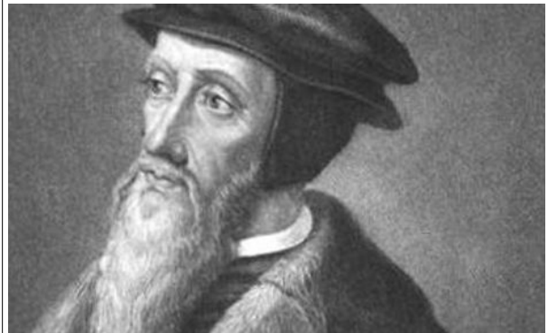
Johannes Calvin (1509 bis 1564)

Wo Gott erkannt wird, da wird auch Menschlichkeit gepflegt.